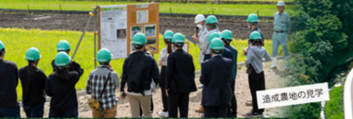
※写真は、2024年度の見学会の様子です。